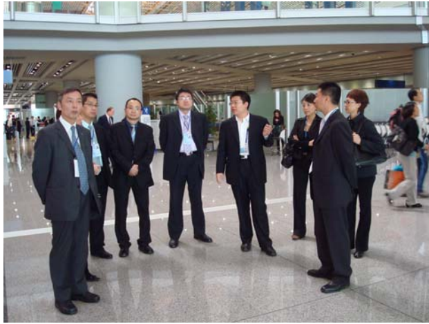
2009.03.19 參觀北京機場 3 號航站樓